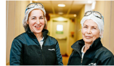
Aramark cuenta con más de 8.000 trabajadores y trabajadoras en el sector minero.

de sitios remotos. Además, la compañía norteamericana complementa sus servicios de alimentación con aseo y limpieza de instalaciones, administración hotelera y servicios de aseo y limpieza industrial.