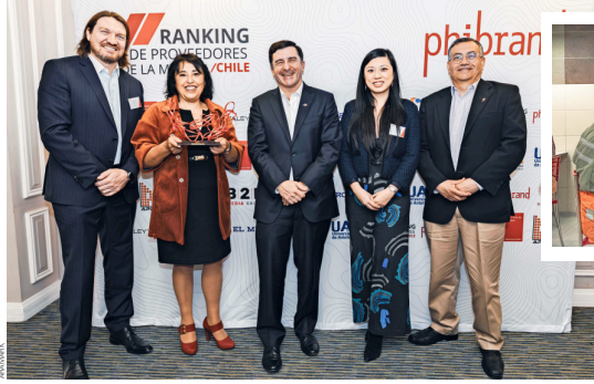
La empresa líder desde hace seis años la categoría Alimentación del ranking.

Actualmente, Aramark opera en 19 contratos del sector minero para las compañías más importantes del rubro en el país, lo que se traduce en más de 110 sitios y 36 mil consumidores. La empresa entrega diariamente más de 100 mil servicios de alimentación, desayunos, almuerzos, cenas y colaciones, buscando siempre aportar una experiencia gastronómica excepcional para los comensales